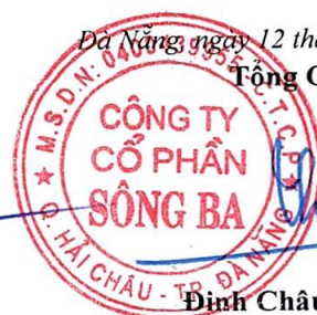
Đinh Châu Hiếu Thiện