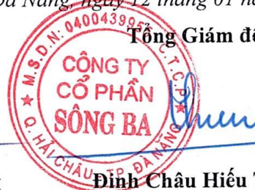
Đinh Châu Hiếu Thiện